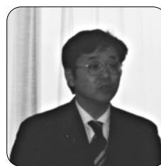
厚生労働省大臣官房厚生科学課課長補佐 中野 滋文氏